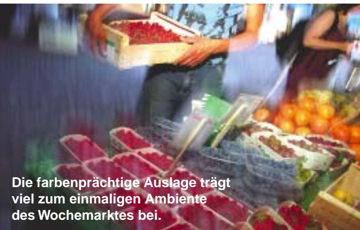
Die farbenprächtige Auslage trägt viel zum einmaligen Ambiente des Wochenmarktes bei.