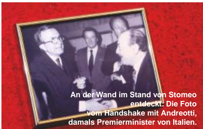
An der Wand im Stand von Stomeo entdeckt: Die Foto vom Handshake mit Andreotti, damals Premierminister von Italien.