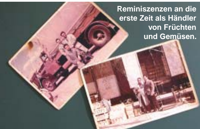
Reminiszenzen an die erste Zeit als Händler von Früchten und Gemüse.